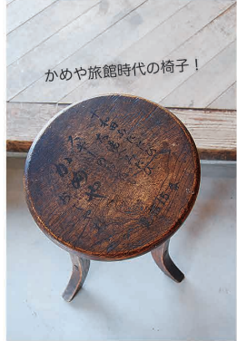
かめや旅館時代の椅子！