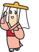
きりたんぼ発祥の地 鹿角のイメージキャラクター たんぼ小町ちゃん