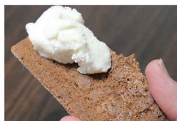
2015年4月発行 / 禁・無断転載

鹿角のスイーツ特集はいかがでしたか？ 鹿角は人口の割にお菓子屋さんが多いような気がします。掲載できなかったお店でも美味しいスイーツはたくさんあるので、ぜひ私たちロケーションかづのまでご連絡下さい。ご要望に沿ったジャンルのお店をご案内させていただきます！ 右の写真は田代せんべい店さんのかわらせんべいの上に、関小市商店さんのかづのジェラートアイス 和練（味噌）のをせ、コラボしてみました！ さくさくのおせんべいと、味噌の甘さを感じられるジェラートの風味がベストマッチです♪